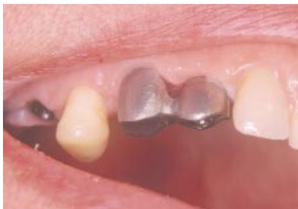
Imagen de la prueba en bizcocho del lado izquierdo, verificándose el ajuste oclusal y comprobando el resultado estético del trabajo. En el lado derecho se tomará un registro de la oclusión con ceras de mordida.

...que a su vez se prueba en boca y se realiza el mismo control radiológico para comprobar su ajuste.