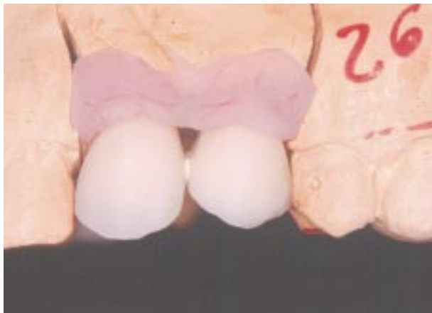
Imagen del recubrimiento cerámico previo a la cocción del primer molar.

Imagen de las piezas del lado derecho una vez realizada la cocción de las porcelanas (en bizcocho).