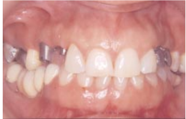
Imagen en detalle de los muñones en los lados derecho e izquierdo. En este momento tomaremos un registro de cera de mordida...