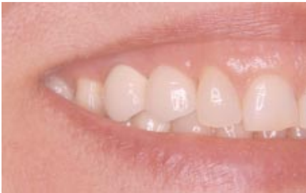
Imagen de la prótesis una vez terminado el trabajo.

Los pilares Synocta serán atornillados a 35 Newtons y los tornillos de la supraestructura a 15 Newtons.